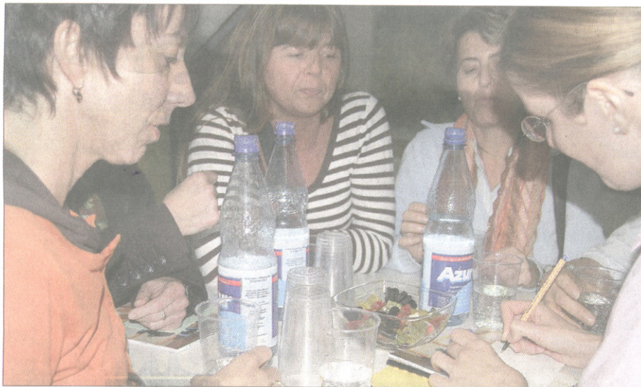
Beim praktischen Teil des Info-Abends zum Hessischen Bildungs- und Erziehungsplan sammelten Erzieherinnen und Lehrerinnen Ideen, wie Kindern der Übergang zwischen Kita und Schule erleichtert werden kann.